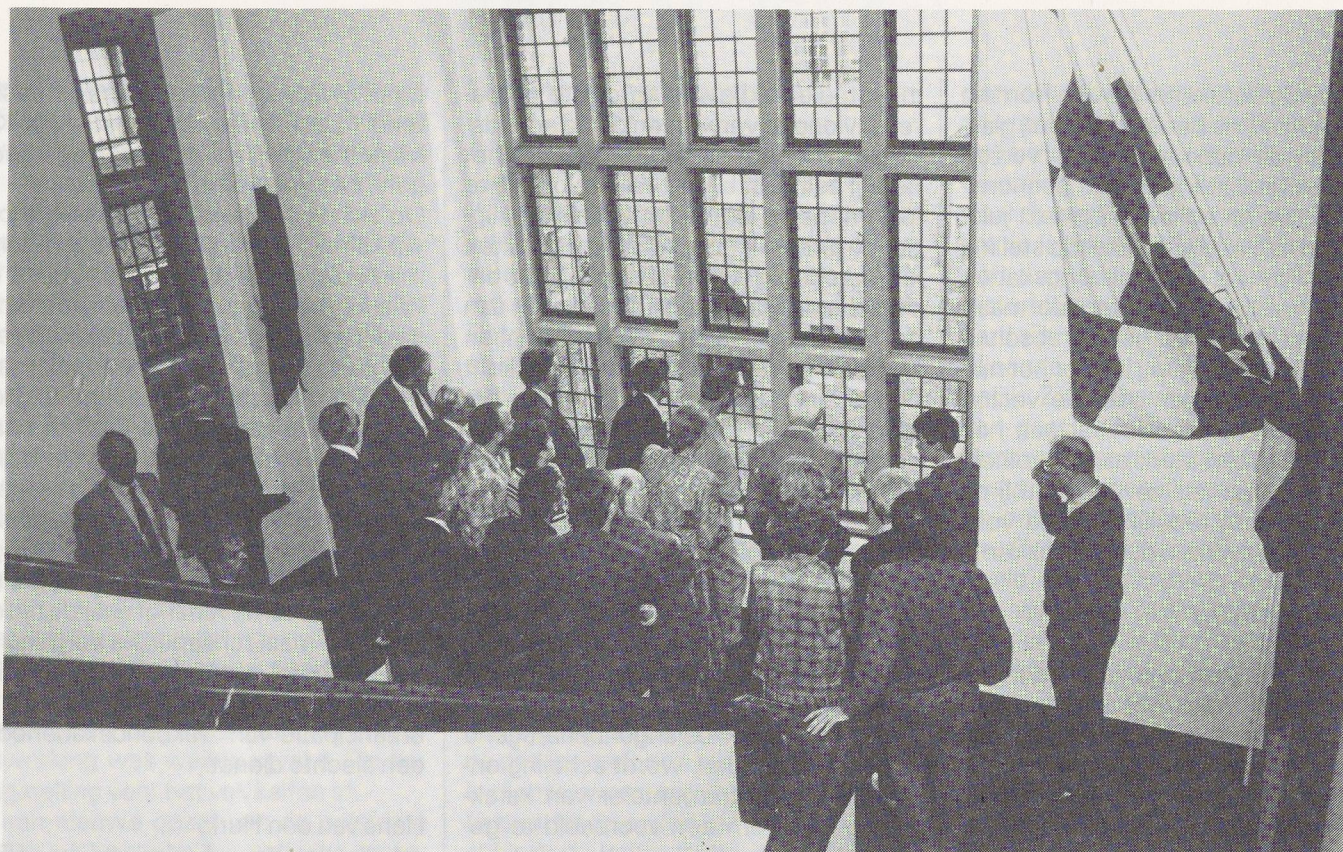
Rondleiding door het 15e eeuwse kasteel in Helmond