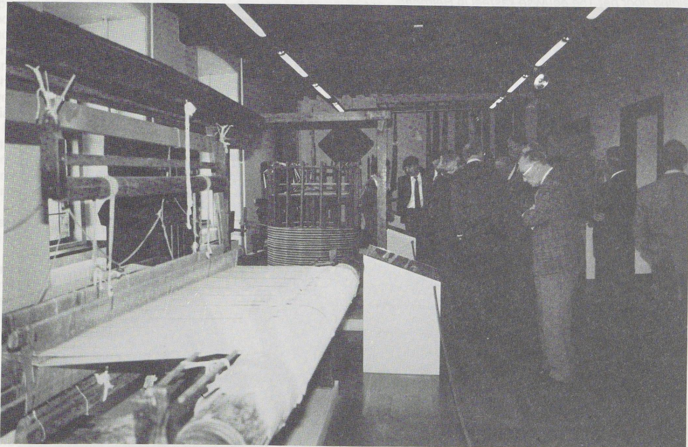
Leden van de VHV krijgen uitleg over het textielverleden van Helmond.