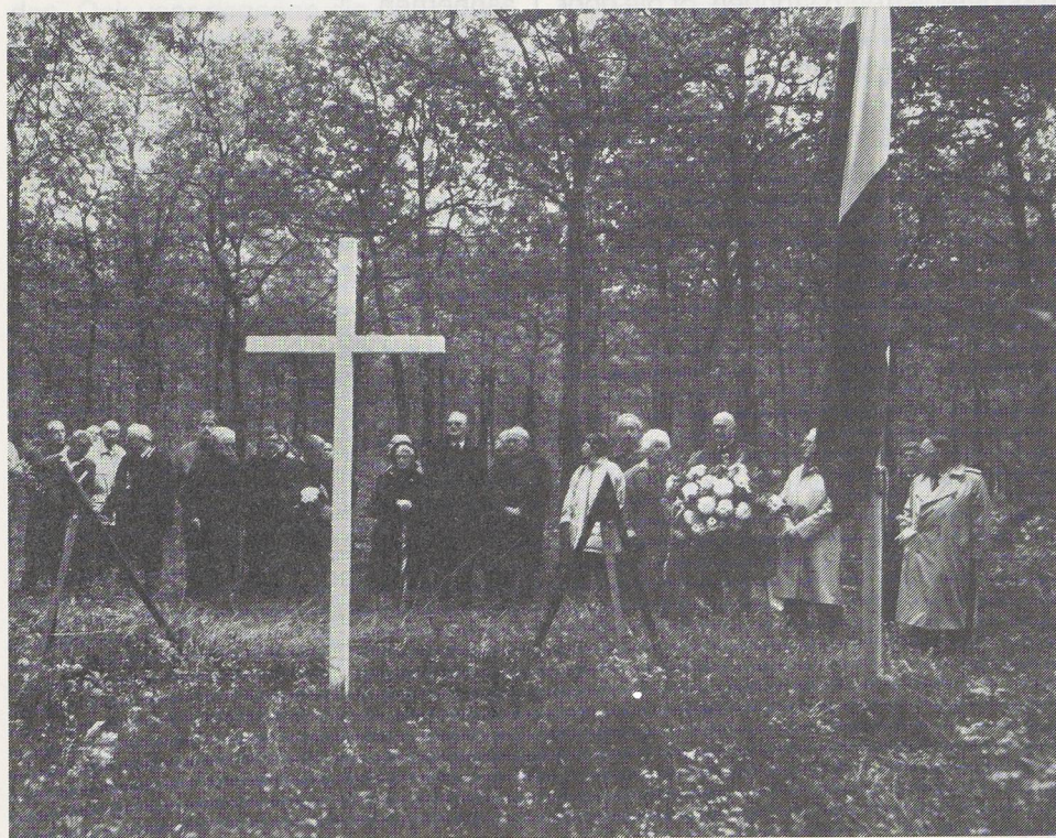
Herdenkingsbijeenkomst op 16 oktober 1992.